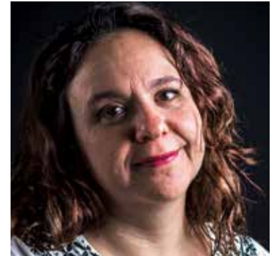
Meksikalı gazeteci Marcela Turati