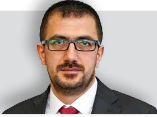
GÖKHAN DURMUŞ TÜRKİYE GAZETECİLER SENDİKASI GENEL BAŞKANI