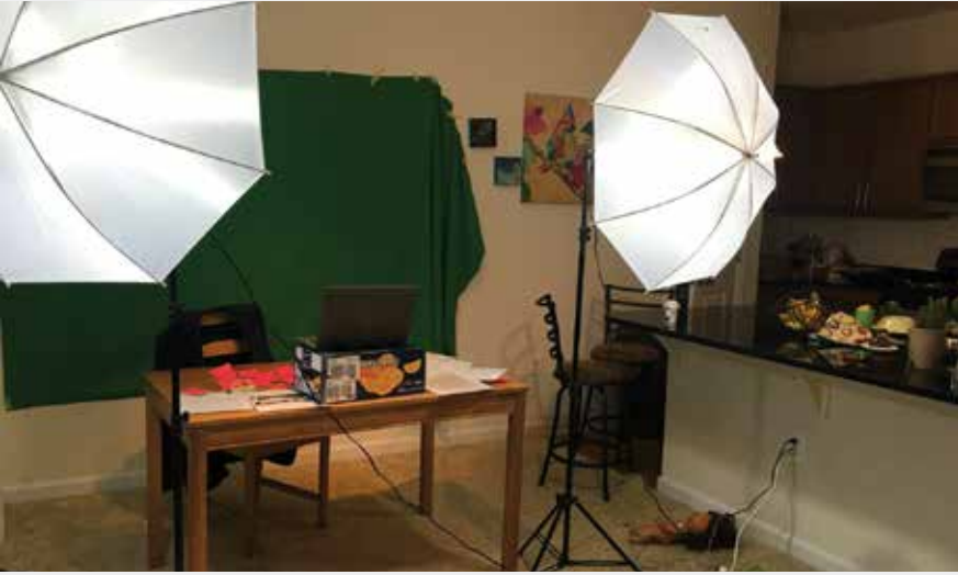
Arslan, gazetecilik yapabilmek için evinin bir köşesini stüdyoya çevirdiğini söylüyor.