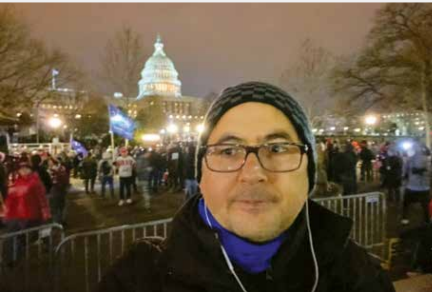
Amerika'daki önemli davaları takip eden Arslan, Beyaz Saray'daki görüşmelere özel önem veriyor.

ki temaslarını izleyemiyorsunuz. 15 Temmuz öncesi az da olsa programları izleyebiliyorduk. Ancak onlarda da çok sorun çıkıyordu. 2016 Mayıs'ında Erdoğan'ın Washington seyahatinde Brookings Enstitüsü'ndeki bir programa davetliydim. 100 yıllık bir kurum Brookings ve Erdoğan'ın konuşması için beni davet etmişlerdi. Yakamda basın kartı ve davetiyem varken Erdoğan'ın korumalarının saldırısına uğradım. Fiili saldırı yaptılar ve binadan çıkartıldım. Her şey kameraların önünde oldu. CNN ve Washington Post gibi saygın kurumlar ilk sayfalarına taşıdı yaşananları. Basın özgürlüğünün adeta kutsandığı bir şehirde bu yaşananlar akıl alır gibi değildi. Nitekim olay ertesi gün dönemin başkanı Obama'ya doğrudan soruldu ve Obama 'bu tip olayların yaşanmasını tasvip etmiyoruz' demek durumunda kaldı.