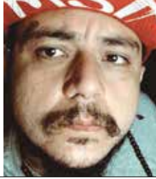
LUCAS SIQUEIRA *

Filistinli foto muhabiri Muath Amarneh, haber takibi sırasında İsrail ordusu tarafından atılan bir merminin sol gözünün hemen altına isabet etmesiyle yaralandı. Amarneh, "Gazeteciliğimi bırakacak değilim, ancak kendimi şu anda güvende hissetmiyorum." diyor.