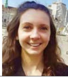
LOU PHILY *

Fransa medya tarihinde gazetecilerin grevler unutulmuyor. Tarihin en uzun grevi 1968 yılında ORTF çalışanları tarafından 7 hafta boyunca sürmüştü. Radio France'da 2015'teki grev 27 gün devam etmişti. Şimdi ise JDD çalışanları, yeni bir genel yayın yönetmeni atanmasını protesto etmek amacıyla 40 günlük grevi sona erdirdiler.