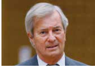
Fransız işadamı Vincent Bolloré