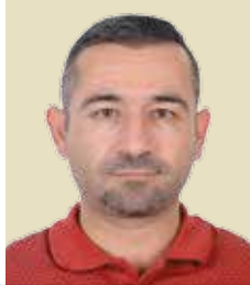
YAVUZ ACAR *

Gazeteciler tutuklanarak, işkenceye maruz kalıyor. Bunun en acı örneği dünya medyasının yakından tanıdığı gazeteci Cemal Kaşıkçı'nın 2 Ekim 2018 tarihinde İstanbul'daki Suudi Arabistan konsolosluğunda öldürülmesi.