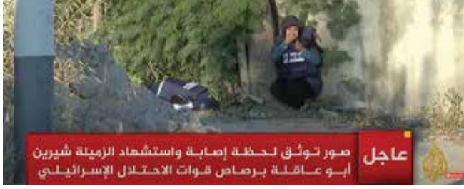
El-Cezire Arapça'dan alınan bir ekran görüntüsünde muhabir Shireen Abu Akleh 11 Mayıs 2022 tarihinde Batı Şeria'nın Cenin kentinde ölümcül bir şekilde vurulduktan sonra yerde yatarken görülüyor.

halktan da geliyor. Uluslararası Gazeteciler Federasyonu'na göre, "20 Haziran 2023'te, serbest foto muhabiri Khalid Taha, işgal altındaki Batı Şeria'nın kuzeyindeki Hawarah ve Nablus kasabaları arasında arabasıyla seyahat ederken İsraili yerleşimciler tarafından saldırıya uğradı. Aynı gün, Al Ghad TV kanalı için çalışan bir gazeteci Nablus şehrinin girişinde İsraililer tarafından dövüldü."